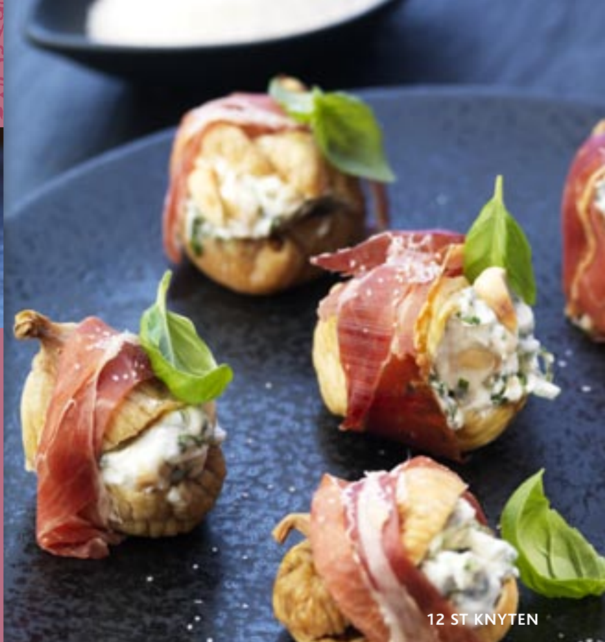
12 ST KNYTEN

HIMALAYA PINK SALT är ett mineralrikt bergssalt som anses vara världens renaste. Det innehåller över 80 grundämnen, däribland järn som gett den fina rosa färgen. Himalaya-saltet har en mild aromatisk smak med finkornig struktur. Det passar i stort sett till all matlagning.